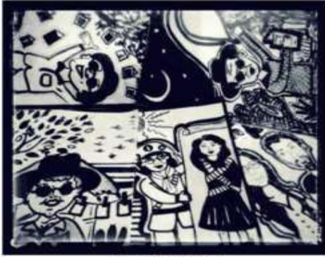
Pâmela Bueno Costa

Observe a imagem e o texto abaixo e responda.